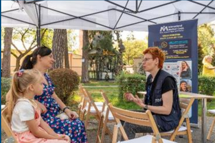
Фахівець з харчування від Міжнародного Медичного Корпусу проводить консультацію в Бучі, під Києвом, під час Всесвітнього тижня грудного вигодовування в серпні місяці.

З липня по вересень командою з питань харчування: