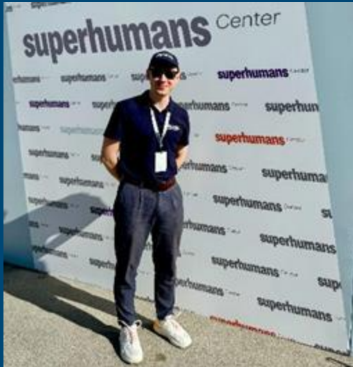
Superhumans - провідний інноватор у сфері фізичної реабілітації - є лише одним із партнерів Міжнародного Медичного Корпусу в Україні.

Міжнародний Медичний Корпус прагне сприяти наданню допомоги на місцевому рівні та розбудові місцевого потенціалу для довгострокової стійкості. Щоб допомогти досягти цієї мети, з липня по вересень Міжнародний Медичний Корпус: