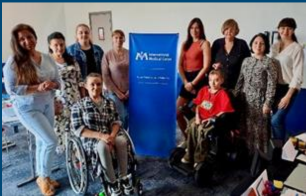
Учасники позують під час триденного тренінгу «Самодопомога плюс», що відбувся у вересні у Варшавському офісі Міжнародного Медичного корпусу.

У період з липня по вересень Польська команда з психічного здоров'я та психосоціальної підтримки (MHPSS):