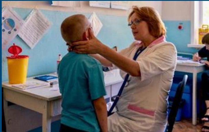
Лікар однієї з мобільних медичних бригад Міжнародного Медичного Корпусу оглядає маленького пацієнта в селі Рогізки на Чернігівщині.

З липня по вересень командою з питань охорони здоров'я: