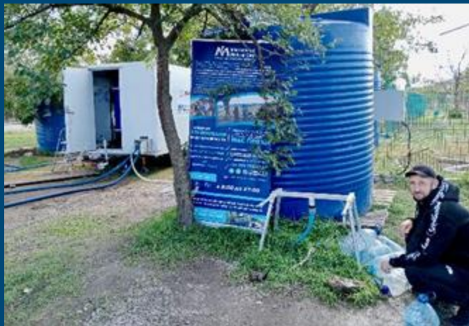
Одна з мобільних водоочисних установок Міжнародного Медичного Корпусу працює у Нововоронцовці Херсонської області, слугуючи надійним джерелом життєво необхідної чистої питної води для місцевих мешканців.